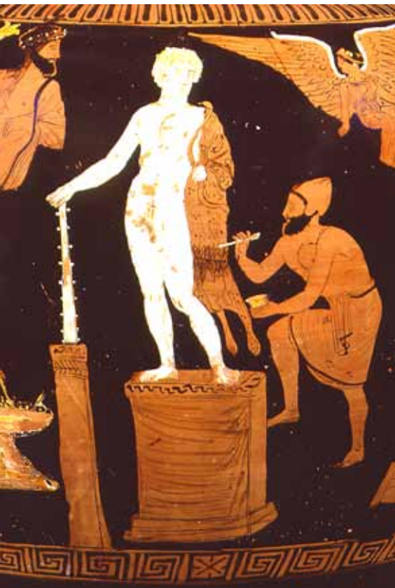
Abb. 6 Vasenbild des 4. Jahrhunderts v. Chr. mit der Darstellung eines Malers bei der Arbeit an einer Statue (New York, Metropolitan Museum, Inv. 50.11.4).

Die seltene Darstellung eines Malers bei der Arbeit an einer vom Bildhauer fertiggestellten, schon auf einem hohen Sockel stehenden Statue zeigt ein Vasenbild des 4. Jahrhunderts v. Chr. im New Yorker Metropolitan Museum (Abb. 6). Der Künstler ist gerade damit beschäftigt, das detailreiche ornamentale Muster des Gewandes auf der wohl glatt zu denkenden Oberfläche auszuführen.