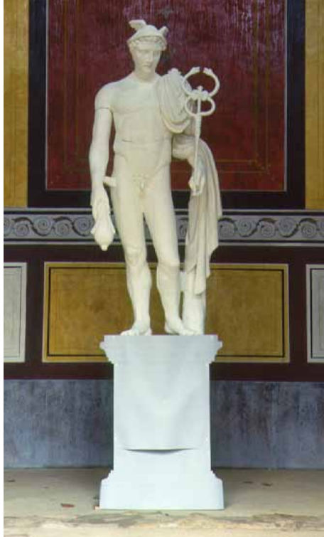
Abb. 11 Probeaufstellung des Hauptmodells im Tempel von Tawern.

Der endgültige Sockel wurde wie die Figur gegossen. Deshalb mußte ich für den Sockel ebenfalls ein Modell im Maßstab 1:1 herstellen. Dieses besteht aber nur aus zwei übereck stehenden Seiten, die jeweils zweimal abgegossen und zu einem geschlossenen Körper montiert wurden. Die Profile wurden mit Zugschablonen in der Technik der Stuckateure gezogen.