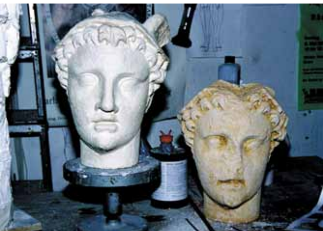
Abb. 9 Abguß des Merkurkopfes aus dem Brunnen von Tawern aus Kunststein (rechts) und Gipsabguß mit Ergänzungen (links).

eine Beurteilung ihrer Länge und ihrer leicht asymmetrischen Bildung. Darüber hinaus mußten nur bestoßene Kanten schärfer nachgearbeitet und Fehlstellen geschlossen werden, was die gut erhaltene Oberflächenbewegung erleichterte.