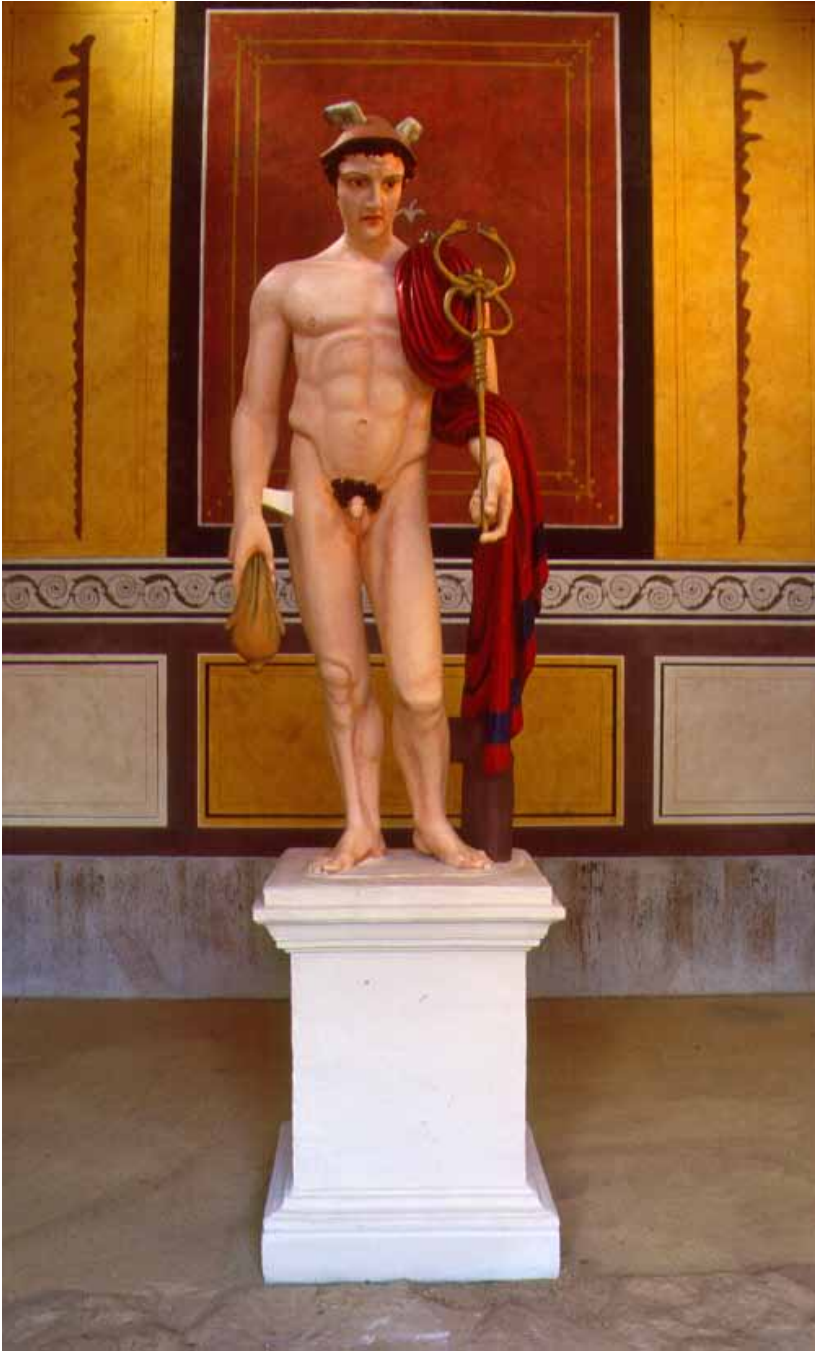
Abb. 14 Farbig gefaßte Merkurstatue auf Sockel im Tempel auf dem Metzenberg bei Tawern.