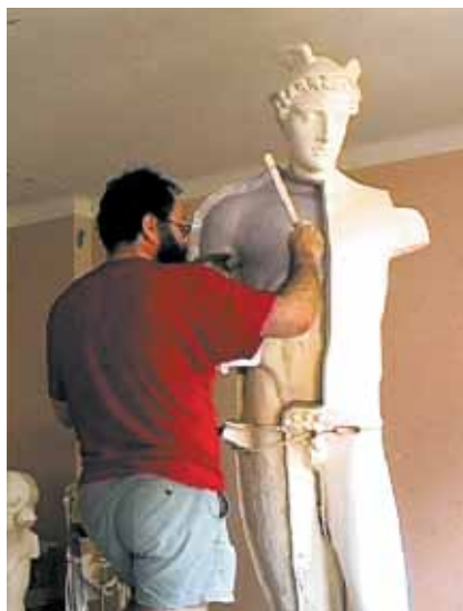
Abb. 12 Herstellung der Gußform.

45 Teilen, die zum Ausformen miteinander verschraubt werden (Abb. 12). Die fertig gegossene Figur wurde von mir so konzipiert, daß sie in drei Teile zerlegbar ist, die bei der Aufstellung nur zusammengesteckt werden müssen: Die größte Partie besteht aus dem Rumpf mit den Beinen, dem Kopf und dem rechten Arm. Linker Arm mit Mantel und Baumstütze werden angepaßt und mit der Rundfibel, die optisch den Mantelbausch rafft und zu diesem Zweck einen Zapfen besitzt, zusammengesteckt. Der Caduceus wird in die linke Hand eingelegt und am unteren Ende mit einem Dorn auf dem Zeigefinger fixiert. Dieser Heroldstab