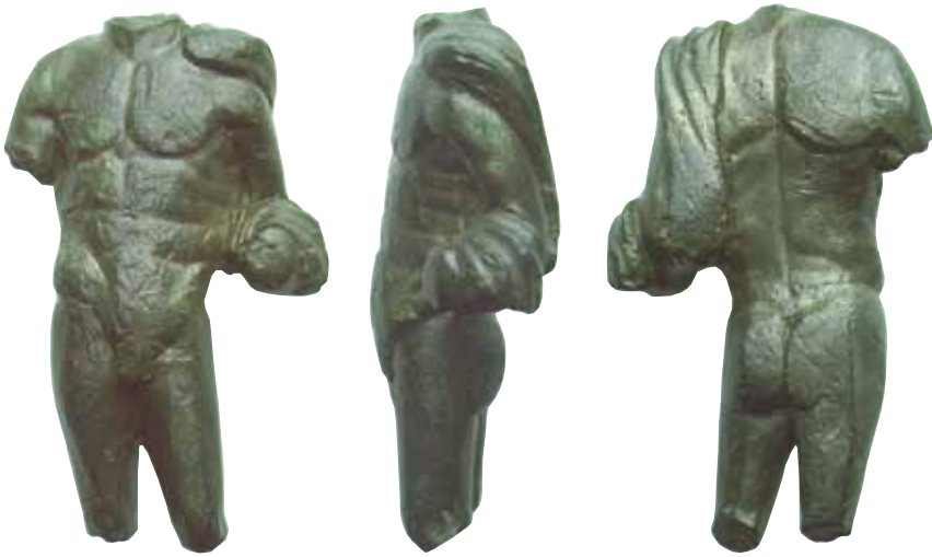
Abb. 4 Torso einer Bronzestatuette, wohl des Merkur, aus dem Vicus von Tawern (Original in Privatbesitz).

Für den Kopf der Statue formte Herr Schneider eine Kopie nach dem Original des 1986 im Brunnen gefundenen Merkurkopfes ab und ergänzte die Fehlstellen im Gesicht, am Haar und an der Kopfbedeckung sowie die fehlenden Flügel. Aus der Größe des Kopfes ergab sich die Höhe der ursprünglichen Figur von etwa 2,08 m.