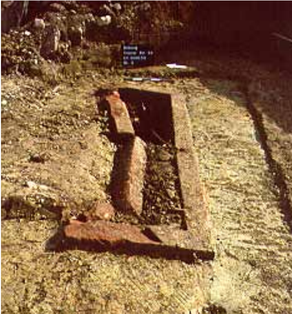
Abb. 2 Bitburg, Trierer Str. 23, Sandsteinsarkophag.

Trümmer gelegt. Dicht bei dem 2000 aufgefundenen Sarkophag war ein Einschlag. Weitere Bombentrichter konnten später in der Nähe festgestellt werden.