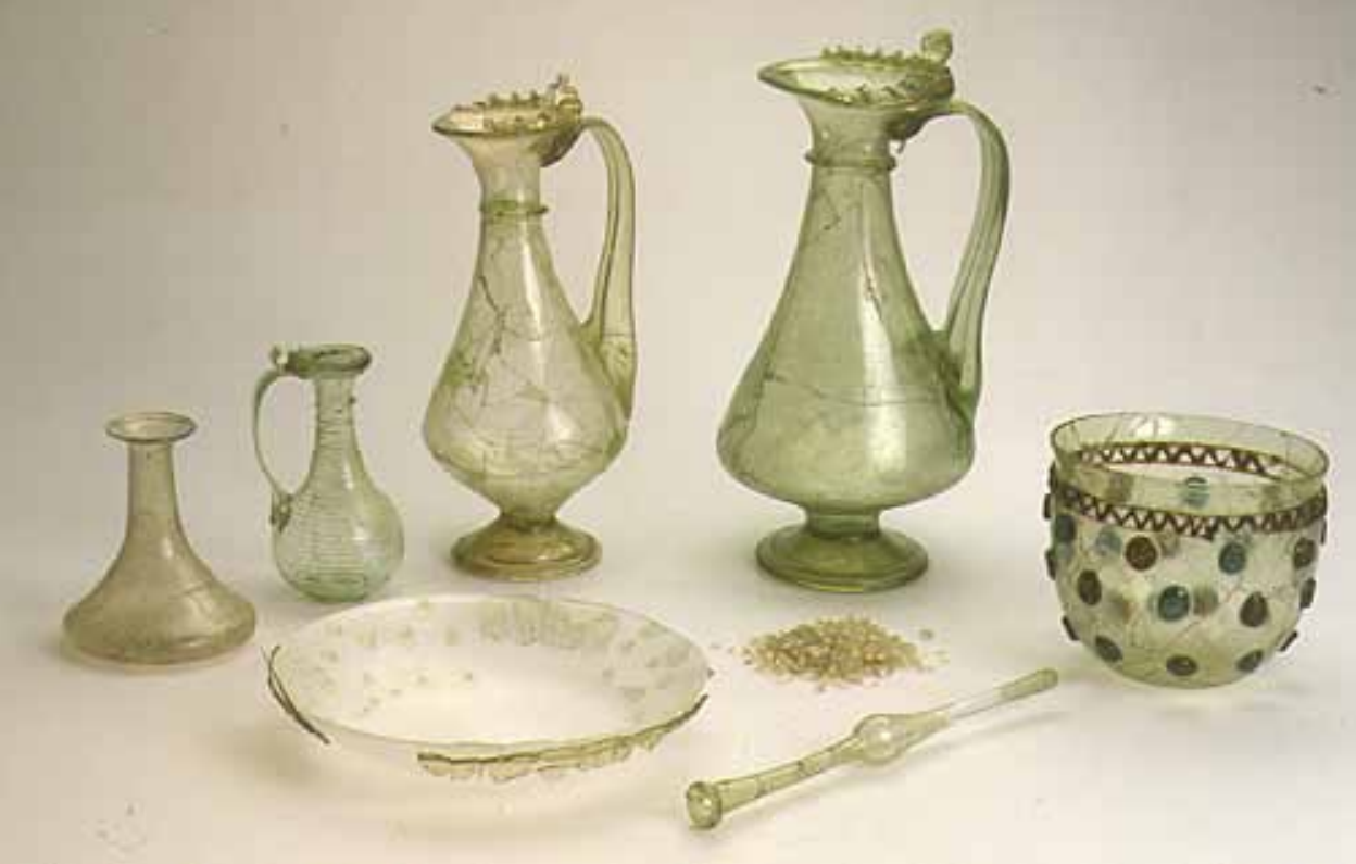
Abb. 3 Gläser aus dem Sarkophag von Bitburg, Trierer Str. 23 (EV 2000,53 FNr. 58).

Schwer zu deuten ist eine große Zahl winziger Glasscherben, die nach Anordnung und Lage keinem Gefäß zuzuordnen sind. Ein Deutungsvorschlag kann hier nur als Hypothese formuliert werden: Vielleicht handelt es sich um den Inhalt einer Kinderrassel aus vergangenem organischem Material (z. B. hartes Leder), das der Verstorbenen als Mutter eines Säuglings oder Kleinkindes mit ins Grab gegeben wurde.