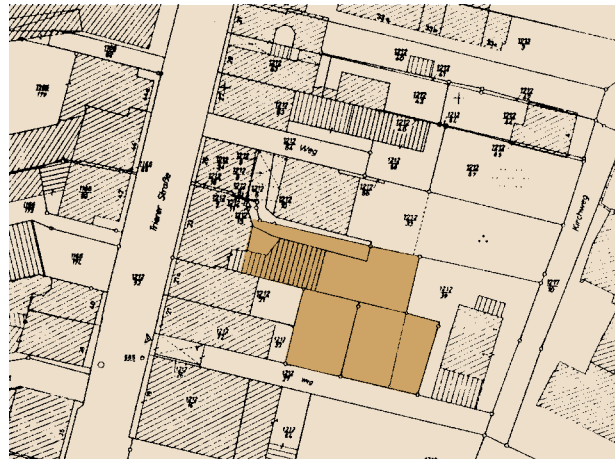
Abb. 1 Bitburg, Trierer Str. 23, Katasterausschnitt mit Eintragung der Grabungsfläche.

Im März 2000 begannen in Bitburg an der Trierer Straße, hinter dem Haus Nr. 23, die Ausschachtungsarbeiten für den Neubau des Hotels Bitburger Hof (Abb. 1). An der Baugrubengrenze stieß der Bagger auf einen mächtigen Sandsteinblock. Bei dessen Beseitigung stellte sich heraus, daß es sich um den Deckel eines römischen Sarkophages handelte. Daraufhin verständigte der Bauherr, Herr Bernhard Zender aus Sülz, das Rheinische Landesmuseum Trier. Schnell zeigte sich, daß der Sarkophag inmitten weiterer Körperbestattungen lag. Parallel zu den laufenden Bauarbeiten und mit Unterstützung des Bauherrn konnten in den folgenden Monaten insgesamt 51 Gräber freigelegt werden. Die Beobachtungen wurden mit Notbergungen im Bereich der Baustellenzufahrt im Mai 2001 abgeschlossen.