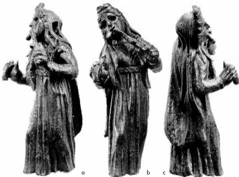
Abb. 1 Bronzestatuetten. M. 1:1.

Im Jahr 1993 kam aus dem Boden des römischen Trier eine kleine Bronzestatuetten ans Licht, die ein ausgesprochen seltenes Motiv zeigt. Leider wurde das Objekt erst im bereits vom Herkunftsort im Stadtgebiet abgefahrenen Aushub entdeckt. Daher läßt sich die Fundstelle nicht mehr mit letzter Sicherheit feststellen. Wahrscheinlich aber stammt die qualitätvolle Statuette aus dem Bereich der Ausgrabungen auf dem Viehmarkt. Das Original befindet sich im Besitz des Finders. Für die Sammlungen des Rheinischen Landesmuseums Trier wurde eine kolorierte Kunststoffkopie angefertigt (EV 1993,34).